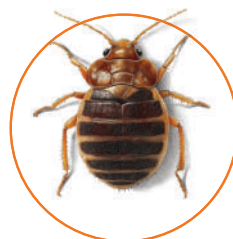
pluskwa domowa ( Cimex lectularius )