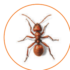
mrówka faraona ( Monomorium pharaonis )