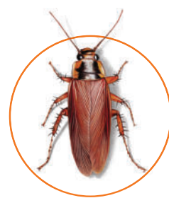
karaczan prusak ( Blattella germanica )