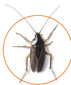
karaczan wschodni ( Blatta orientalis )

Effect Microtech CS PRO RTU jest przeznaczony do profesjonalnego zwalczania: