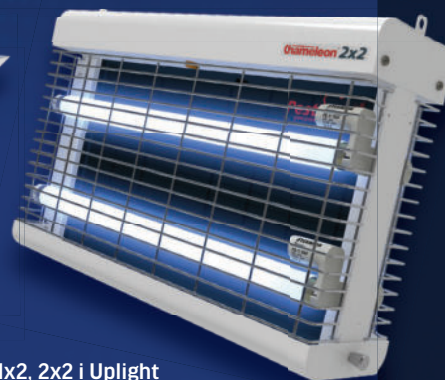
Zaprojektowane i dopasowane do lamp owadobójczych Chameleon 1x2, 2x2 i Uplight