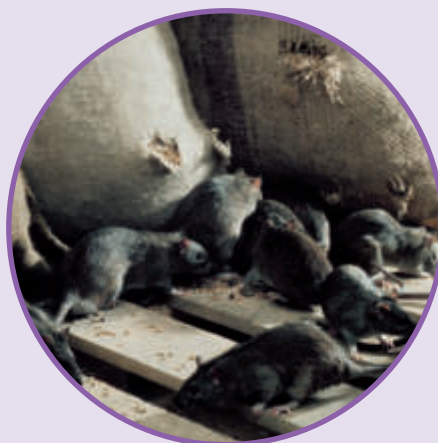
SZCZUR ŚNIADY Rattus rattus