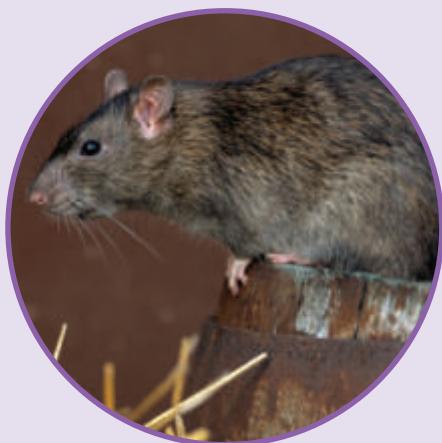
SZCZUR WĘDROWNY Rattus norvegicus