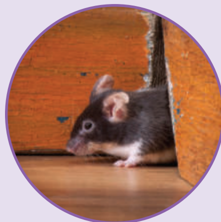
MYSZ DOMOWA Mus musculus